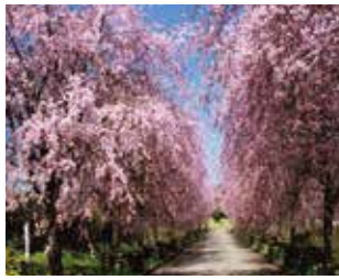
4月 - 京都府绿化中心の桜花