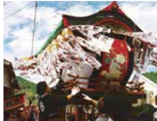
10月 - 额田の山车祭典