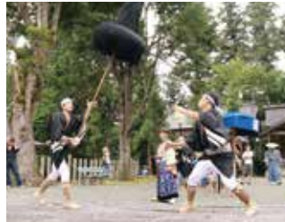
9月 - 元伊勢八朔祭典