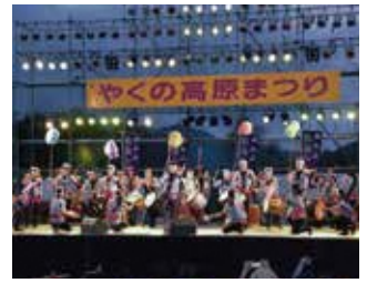
8月 - 夜久野高原祭典