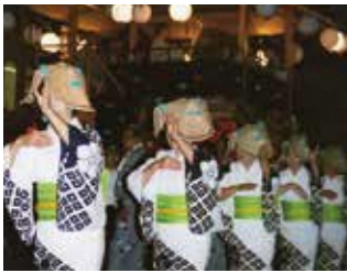
8月 - "Dokkoise" 祭典