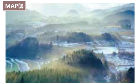
MAP18 可从宝山公园瞭望台眺望的流霞

宝山喷发出的熔岩营造出的大自然鬼斧神工，尽收眼底。晚上会点灯（黄昏到晚上9点）。[地址]福知山市夜久野町小仓8098-1 [咨询]0773-37-1103（福知山市夜久野分所）