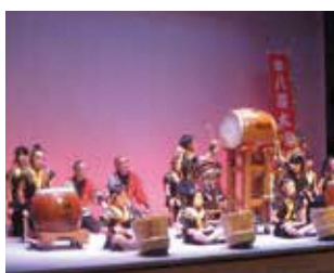
11月 - 三和交流会