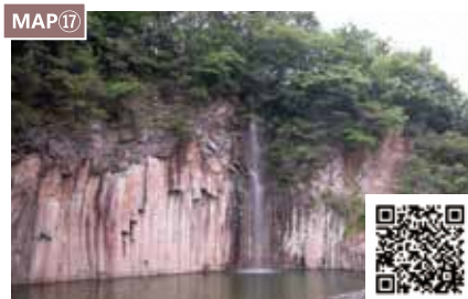
MAP17 夜久野玄武岩公园

这里有农产品直销店、日式点心店、可以体验漆画的设施等，可以亲身感受夜久野的文化和自然。还设有24小时可用的厕所和停车场（普通车170辆、大型车5辆、身体障碍者用车3辆、EV快充桩）。