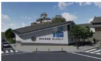
建造中的新的铁道馆(令和5年夏天落成开业)

平成10 (1998) 年开业的福知山铁道馆Poppo Land 1号馆向世人传达了“铁道城市福知山”的历史，深受人们的喜爱，但由于年久失修，从平成30 (2018) 年开始处于闭馆状态。目前在福知山城公园内建造新的铁道馆。新的铁道馆不仅拥有多次惠顾也能享受的各类体验型内容，而且该设施向世人传达与铁道一起繁荣起来的福知山市的历史和主体性，人们可以体验“铁道城市福知山”的风采。