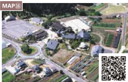
MAP16 道之驿 农匠之乡夜久野

夜久野高原被认为是30至38万年前 京都府唯一的火山——宝山喷发形成的。 这里收获的农作物以甘甜美味著称。