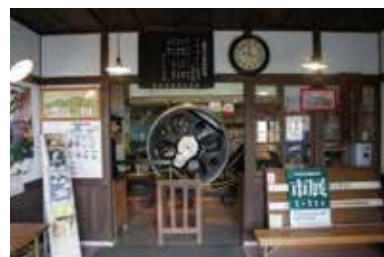
闭馆中的福知山铁道馆Poppo Land 1号馆