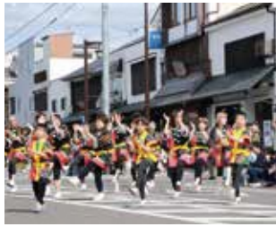
4月 - 福知山城祭典