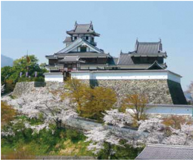
4月 - 福知山城の桜花