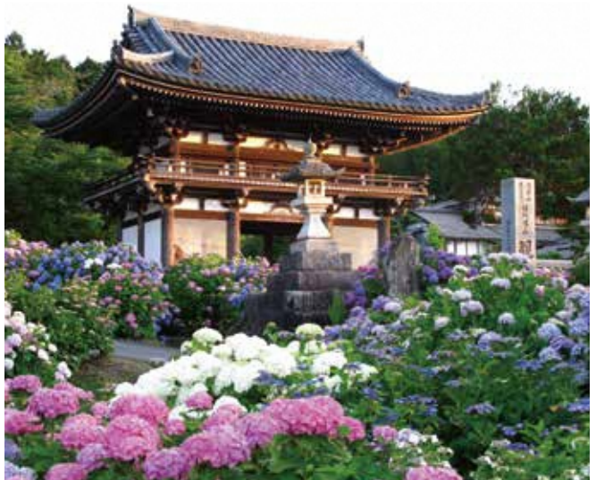
6月 - 华观音寺の绣球花