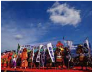
10月 - 大江山酒吞童子祭典