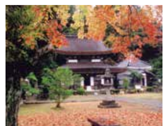
11月 - 天宁寺の红叶