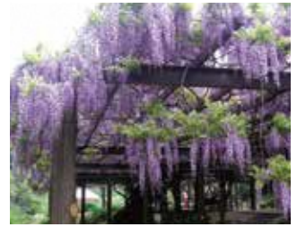
4月 - 才之神藤公园的紫藤