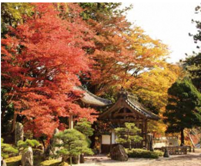
11月 - 长安寺の红叶