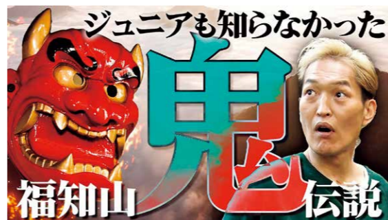
WEB動画「ジュニアも知らなかった！福知山の鬼伝説」サムネイル

鬼伝説が残る大江山をはじめとする「鬼の聖地・福知山」の認知拡大を目的に、本市出身の人気お笑い芸人・千原ジュニアさんと市がコラボレーションした動画を「千原ジュニアYouTube」で公開しています。動画は「ジュニアも知らなかった！福知山の鬼伝説」と題し、千原ジュニアさんが、市内の鬼にまつわるスポットを探访する内容となっています。