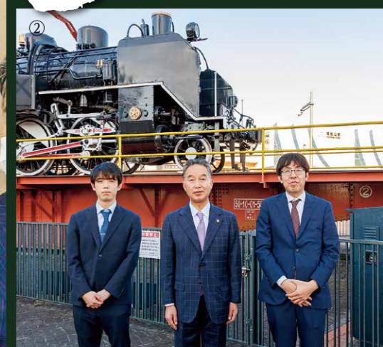
① 藤井竜王は勝負めしメニューブックの品数の多さに「対局前から長考してしまいました」とコメント ② SLの前に鉄道のまち福知山の歴史に触れる対局者と大橋市長