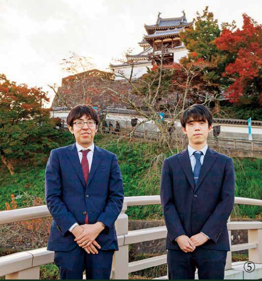
③ 福知山城では子どもたちが対局者をお出迎え ④ 前夜祭での対局者の姿をカメラに収める参加者 ⑤ 福知山城を背景に昇龍橋でフォトセッション ⑥ 勝利を取めた前回の福知山城対局と同じ結果に、と意気込みを見せる広瀬八段