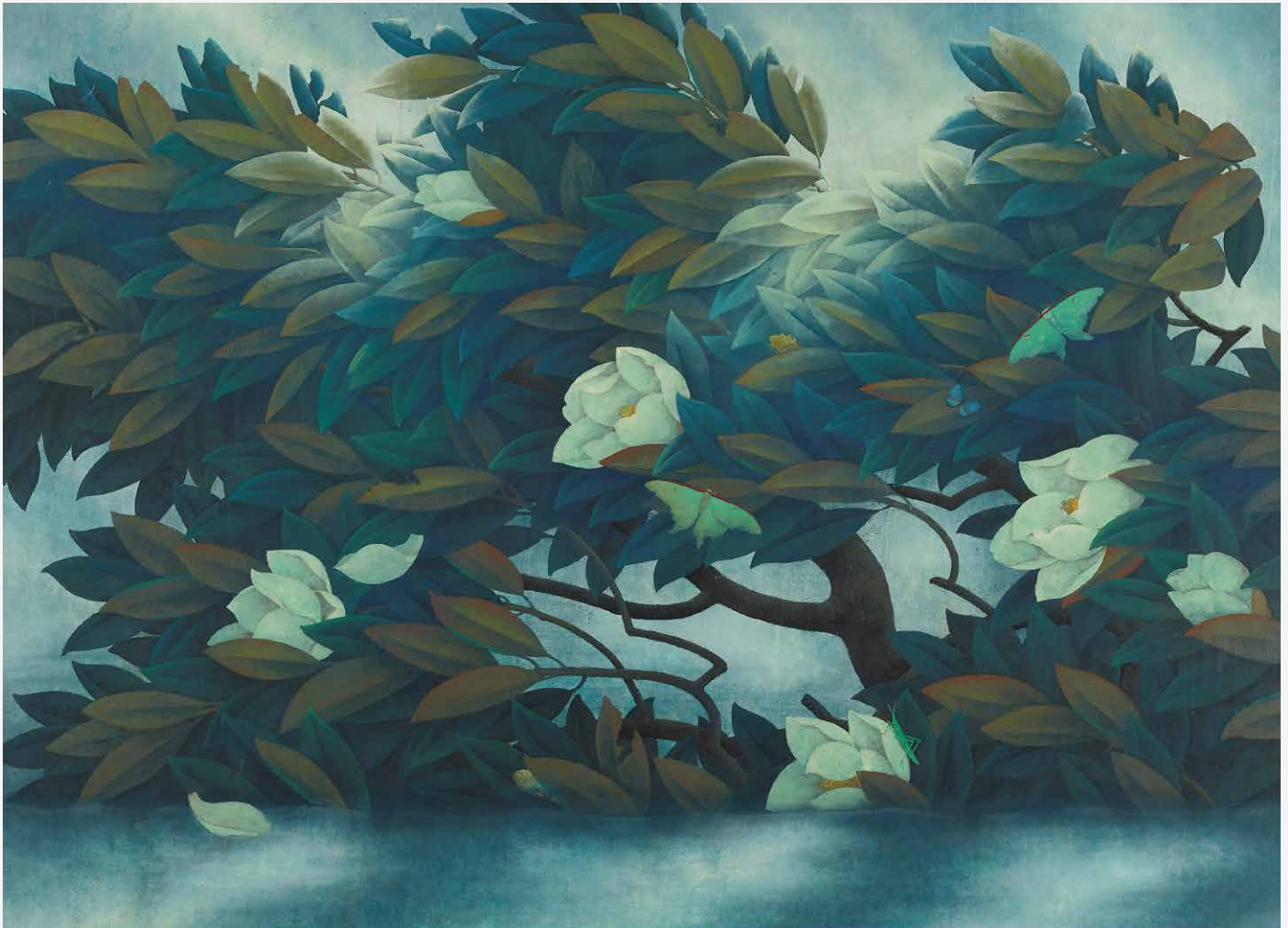
福知山市出身の画家 故 佐藤太清画伯作「洪」(福知山市佐藤太清記念美術館所蔵)