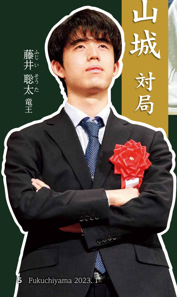
藤井 聡太 竜王