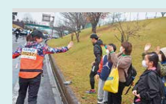
撮影者 松田 寛之さん