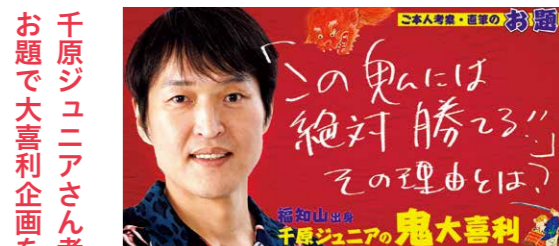
大喜利企画では集まった回答を千原ジュニアさんが審査。「ジュニア賞」に選ばれた回答者には、直筆サイン色紙や鬼土産の詰め合わせ、1万ふくぼなどの景品が贈られる。※回答受付は終了しています