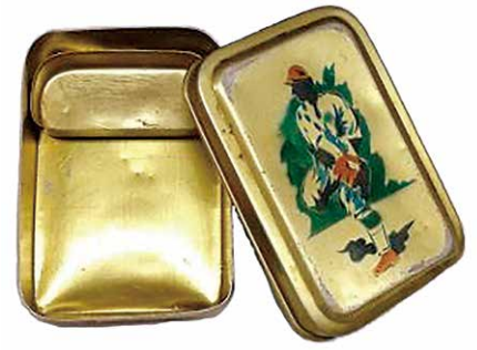
おかず入付アルマイト弁当箱

現在では様々な素材の弁当箱がありますが、職場や学校へ弁当持参の習慣が浸透したのは明治時代からで、その頃の容器は竹皮や柳行季などの植物素材のものでした。明治30年（1897）になると、軍用弁当箱として機能性を重視したアルミニウム製の弁当箱が作られました。酸に弱く、梅干しを入れると腐食して穴が開くことがありました。