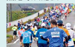
撮影者 藤澤 夕季さん