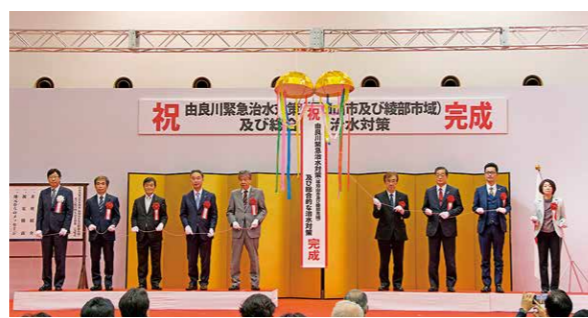
12月10日(土)に行われた完成式の様子。治水対策の完成を祝うくす玉が割られた。

過去の災害で被害を受けた地域を中心に、連続堤防の整備や河川の改修などの治水対策を進めてきた両事業。本市では、雨水を一時的に貯留する施設の整備や排水ポンプなどの強化に取り組んできました。