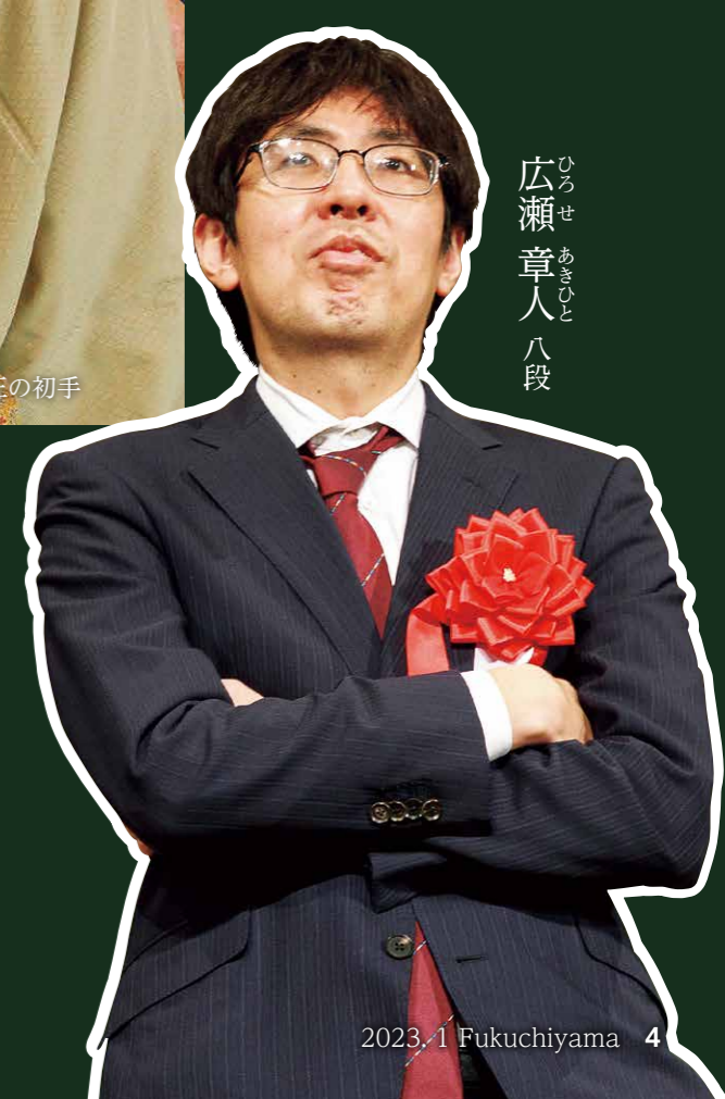
広瀬 章人 八段

対局は2日間にわたり、9日午後3時21分に終局。藤井竜王の勝利で、第35期竜王戦第4局福知山城対局は幕を閉じました。 山城へ移動。本丸広場では、憧れの棋士たちの到着を心待ちにする大勢の子どもたちが出迎えました。 その日の夜には、厚生会館で「前夜祭」を開催。対局者2人も登壇し、対局への意気込みを語るなど会場に集まった380人の将棋ファンを楽しませました。福知山の印象について聞かれると、藤井竜王は、「車窓から見る景色は自然が多く、良いところだと思いました」と話し、広瀬八段は「福知山は地元の方の熱意が感じられる場所」と思い入れを語りました。