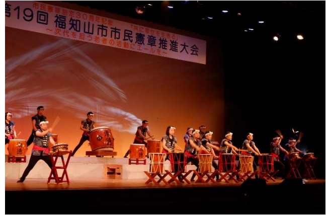
(令和3年度市民憲章推進大会 福知山淑徳高校和太鼓演奏)