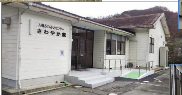
館内を機能改修し、さわやか館を移転 （中田集会所機能を併設）