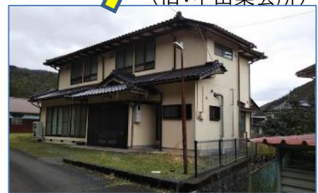
敷地をさわやか館と一体利用