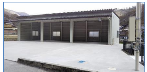
さわやか館駐車場・作業場 を整備