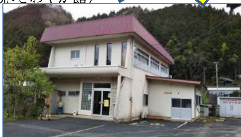
旧上夜久野児童館を機能改修し移転