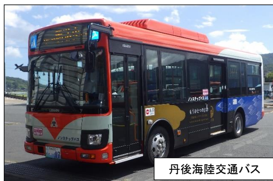
丹後海陸交通バス