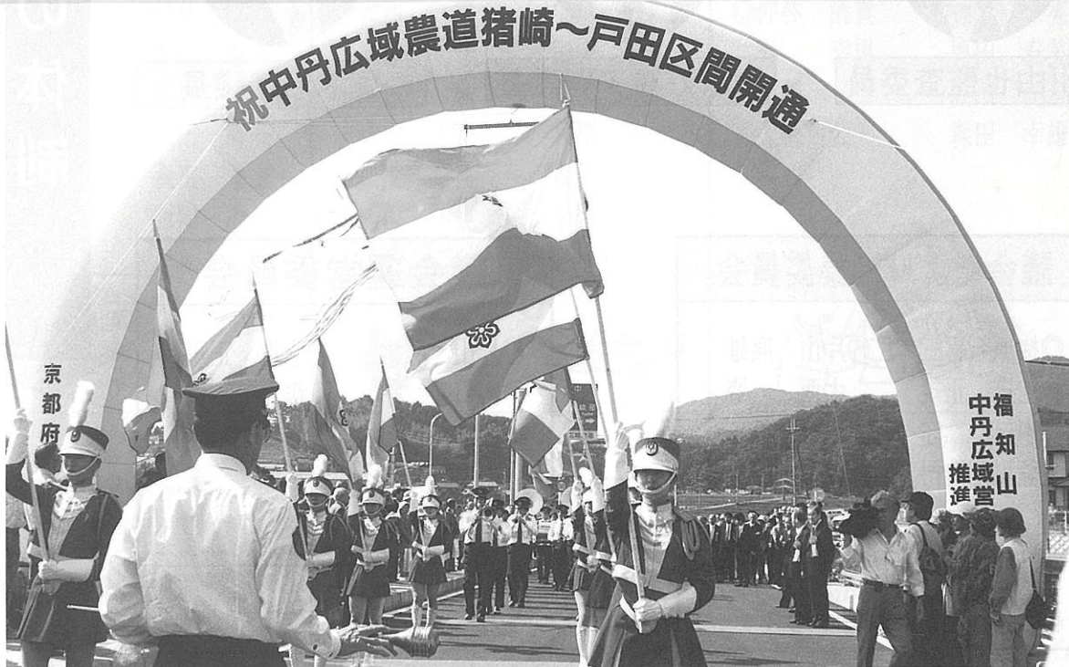
中丹広域農道「さくら橋」渡り初め