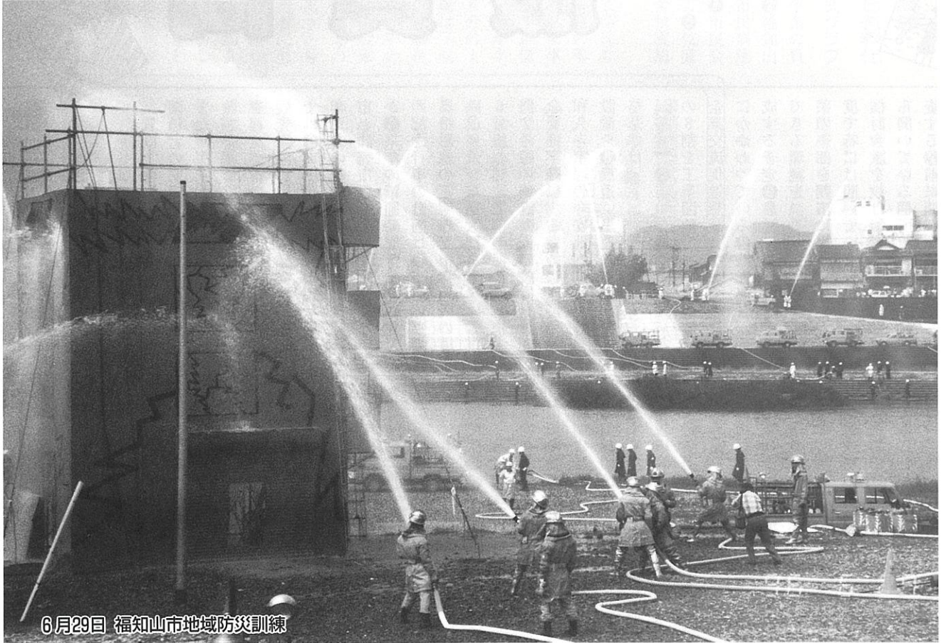
6月29日 福知山市地域防災訓練

編集 福知山市議会だより編集委員会 福知山市字内記13の1 ☎0773(22)6111