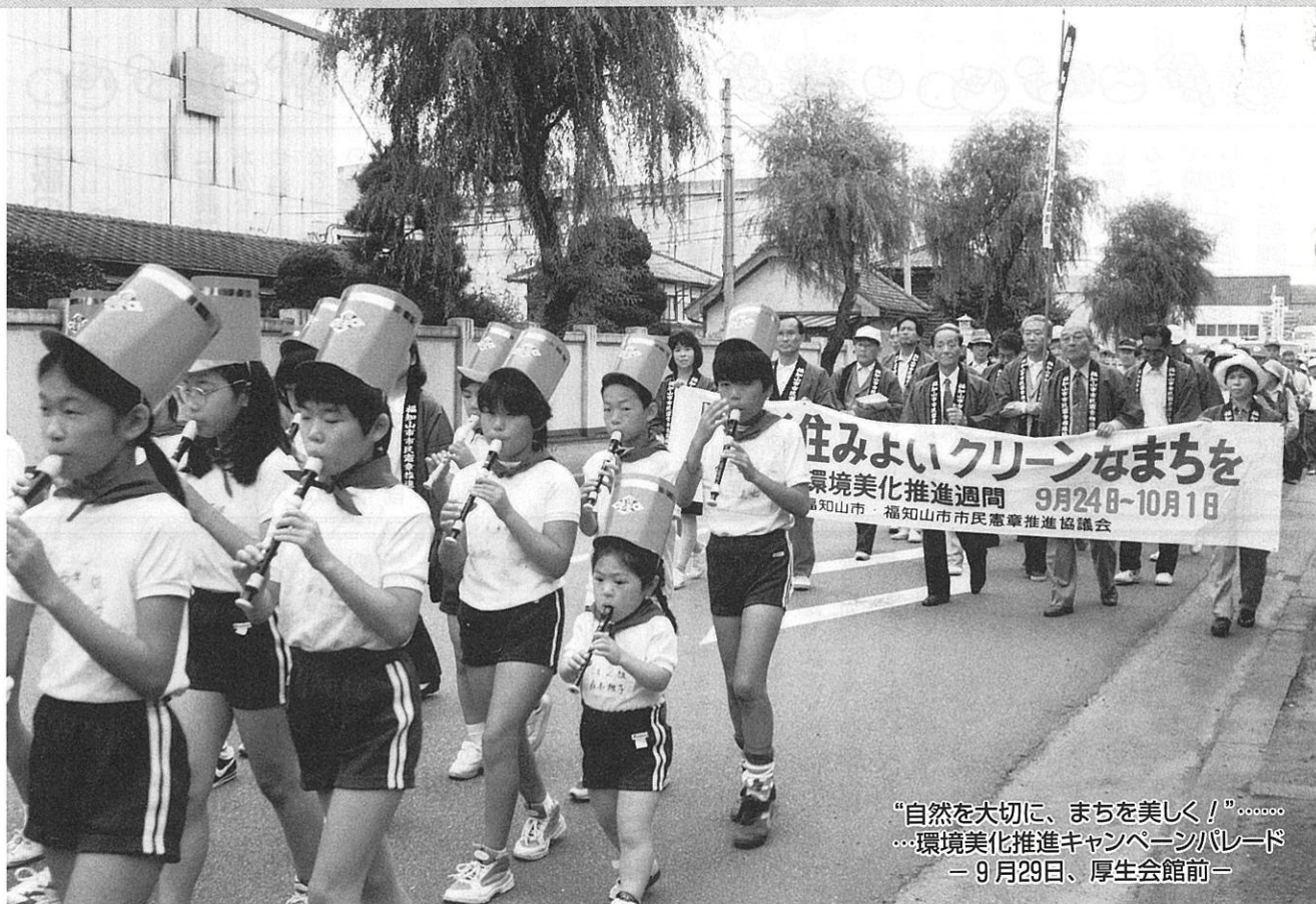
“自然を大切に、まちを美しく！”…… …環境美化推進キャンペーンパレード — 9月29日、厚生会館前 —

編集 福知山市議会だより編集委員会 福知山市字内記13の1 ☎0773(22)6111