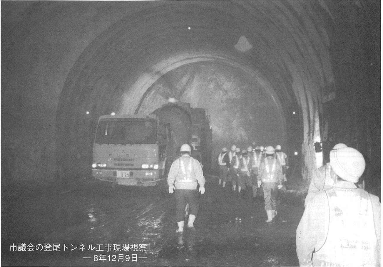
市議会の登尾トンネル工事現場視察 — 8年12月9日 —

編集 福知山市議会だより編集委員会 福知山市字内記13の1 ☎0773(22)6111