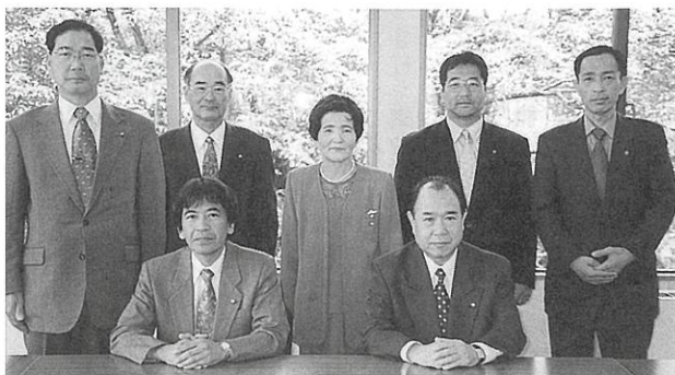
議会だより編集委員会

5月臨時会で議会の新しい体制が決定し、議会の役割と責任を認識して、市民の負託にこたえるように取り組む決意です。 「議会だより」が市民のみなさんにより分かりやすくご理解いただけるよう、編集委員一同心を新たに集って編集に努力いたします。