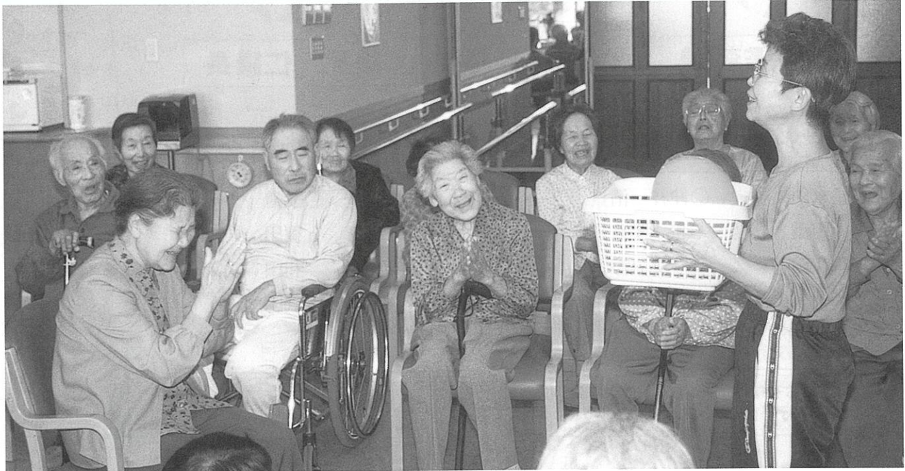
介護保険制度がスタート（市内施設で）