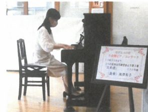
「5分間ピアノコンサート」は開放的なラウンジで開催。