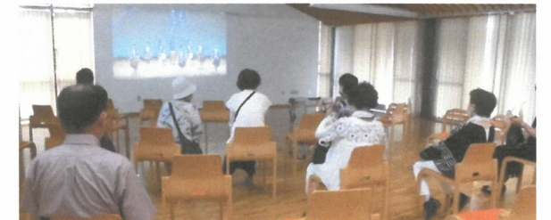
舞台発表は、事前に収録した映像を2日間に何度も上映。