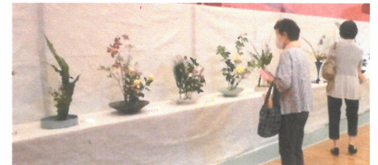
作品は、広々とホールに展示。外扉開放で換気にも配慮。