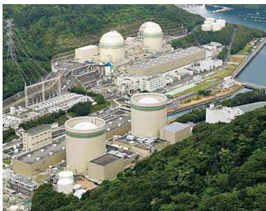
稼働40年を超えた高浜原子力発電所1、2号機