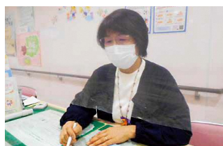
子育てコンシェルジュが対応(子ども政策室)

相談内容は、離乳食や子どもの発達の関係のほか、本市は他市から転入される方も多いため地縁血縁がないことに伴う相談も多い。『すくすくひろば』で行っている相談