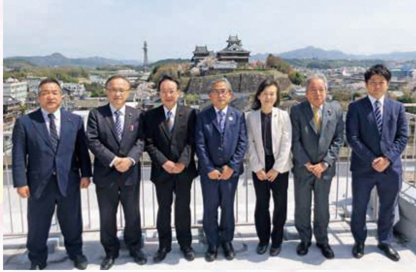
福知山城をバックに ※写真撮影のためマスクを外しています。

広報広聴委員会では、議会だよりの編集や議会報告会の運営などを担当しています。現在のメンバーで「議会だより」を編集するのは最後です。市民の皆さんに分かりやすく親しみの持てる「議会だより」の発行に取り組んできましたが、編集に携わった各委員からその苦労や熱い思いを伝えます。