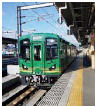
令和2年2月から運行している車両

KTR 支援事業 問 更新車両の沿線自治体の負担割合と耐用年数は。 答 車両1台当たりの費用は、1億8100万円であり、宮津線と宮福線の沿線市町で距離によって按分し、宮津線側で1億3273万3千円、宮福線側で4826万7千円の負担となる。耐用年数は、30年である。