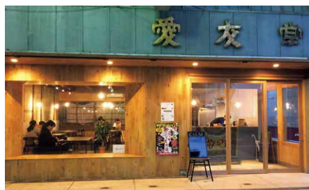
キッチン付レンタルスペース「アーキテンポ」

A 2年前より、起業前に出店のチャレンジができる場として新町商店街に、キッチン付レンタルスペース「アーキテンポ」を開業しました。この企画を通して今までに、3店舗が開業しました。このような流れを通して福知山の賑わいにつなげていきたいと思っています。