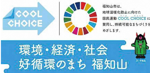
福知山市「COOL CHOICE 宣言」

答 平成30年度に、地域新電力会社、龍谷大学、京都北部信用金庫など金融機関2社に、本市を入れた5者で締結した協定は、本市のエネルギー事業の根幹となるものである。再エネ推進策として、令和2年度より開始した、公共施設への再エネ100%電力の供給や、昨年度取り組んだ省エネ啓発事業などがある。令和3年度予算においては、街路灯や公園灯、本庁舎、小中学校などのLED照明化や公用車のEV化など、再エネ省エネ推進を実施していく予定である。