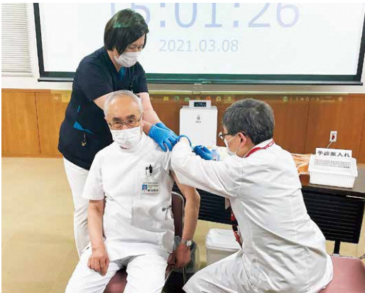
接種を受ける市民病院 香川院長