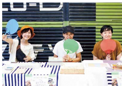
福知山ワンダーマーケットによる

A 2016年10月から毎月第4日曜に開催している定期市です。市内はもとより綾部市や京丹後市、神戸市など関西圏内より40〜60店舗が並び、これまでの来場者は多いときで、1日2千人程度。また、多数の公立大生にも、手伝ってもらっています。