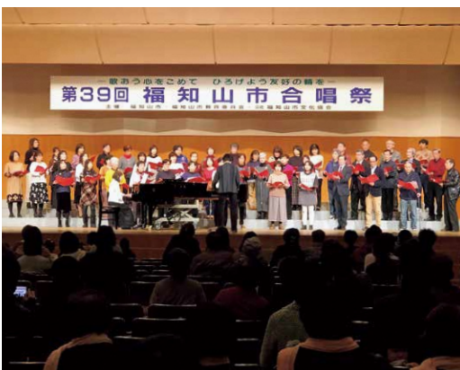
整備着手が待たれる文化ホール 新ステージから市民に文化を