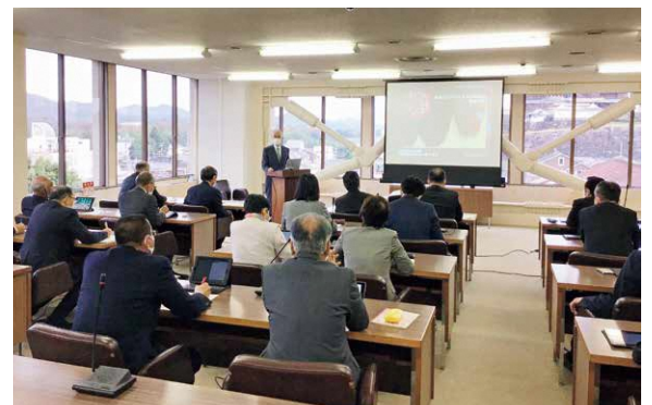
新型コロナウイルス感染症について学ぶ

ら、これまでから大切に取組まれてきた人材育成、チームワークの精神が大きな役割を果たしたものと考える。 ・その他に、超高齢化・人口減少社会における病院運営の方向性や、手術ロボット導入など医療のさらなる高度化、若手医師の確保の方策などについての話題があり、常に先を見据えた病院のあり方が考えられている。 ・高度医療の推進と同時に、市民目線からの満足度もいっそう大切にされ、今後も市民の拠り所となる病院としてますます充実されるよう、委員会としても市民病院の取り組みに引き続き注目していきたい。