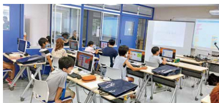
小学生向けプログラミング教室 (R2.8月)

国際交流センター研究活動費は、小学校・中学校・高等学校の児童生徒に対し国際交流の促進や、市民の異文化理解への促進といったイベントを実施す