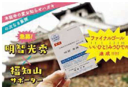
大河ドラマによる効果などで寄附金が増額

返礼品の種類が増加、大河ドラマによる効果、コロナ禍により自宅で過ごすことが増えたことなどにより、ふるさと納税をする人が増えたことなどが考えられる。