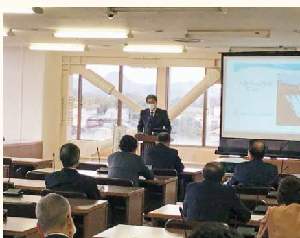
「大野ダム」視察の成果を報告