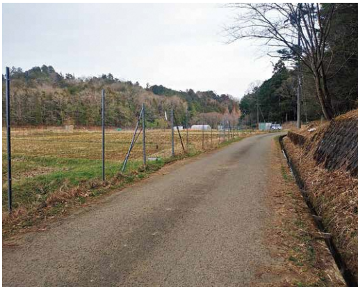
離合が難しくトラブルが多発している動物園駐車場に向かう農道（三段池東谷地区）

問 動物園隣接駐車場へは、東谷農道を通ずるしかなく、農耕者と来訪者のトラブルが多発している。進入路の現状認識は。