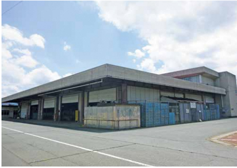
指定管理が終了する公設地方卸売市場

いる。その内容は、道路境界線から敷地側の1mを緑化ゾーンとし植栽を施すもので、土地が売却されれば、本市が対応する工事である。