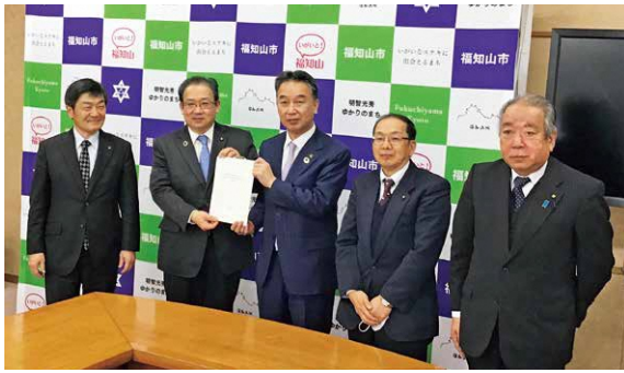
市議会から市長へ政策提言を提出

こうした活動の成果として、産業建設委員会から「地域づくり組織によるまちづくり」と「市周辺部の交流拠点施設のあり方」に関する政策提言が提案され、2月26日に市長に提言書を提出しました。