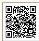
行政視察研修報告会録画配信はこちらから

市議会ホームページで報告書を公開しています。また、報告会の様子は、同ホームページの「委員会等の録画配信」から視聴できます。