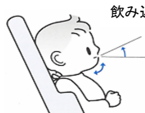
飲み込みやすい姿勢