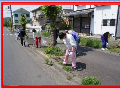
地域のクリーン活動