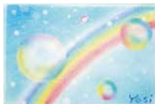
写真はパステルアートのイメージです。デザインは変更となることがあります。

※申込受付後、パステルアートの描き方資料と材料、メッセージ記入用紙をお届けします。