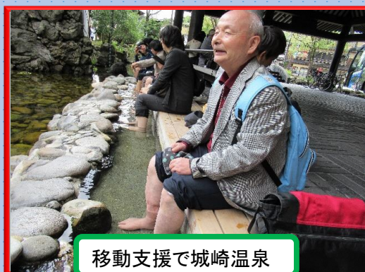
移動支援で城崎温泉