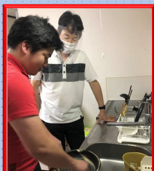
居宅支援(家事援助)