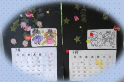
カレンダーづくり

支援学校・支援学級等に通う小中学生が放課後の時間に友だちや指導員と活動しています。自然の中で身体を動かし五感を豊かに育む、人との関わりにより他者と共感することや社会的なルールを身につけていく事を目的としています。