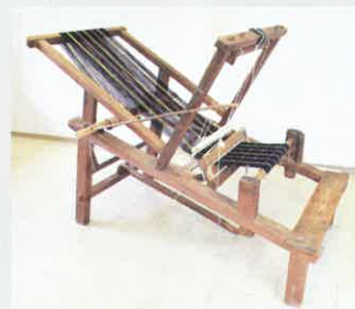
山城の大和機 / 京都府立山城郷土資料館