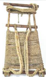
丹後のセイタ / 個人蔵