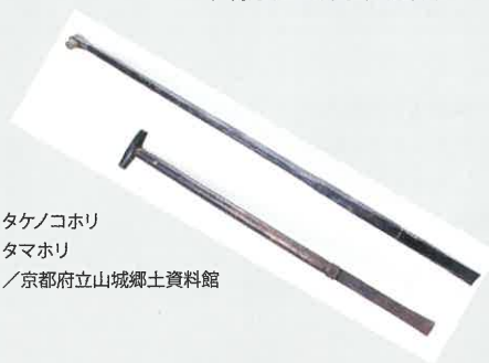
タケノコホリ タマホリ / 京都府立山城郷土資料館