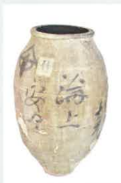
通い茶つぼ / 京都府立山城郷土資料館