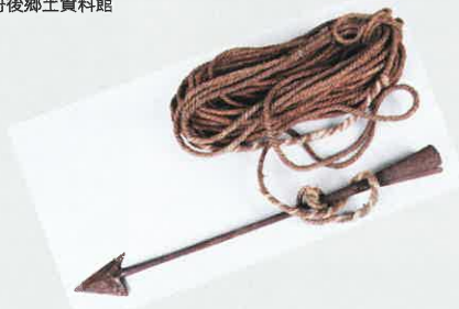
クジラモリ