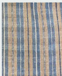
丹波木綿経緯布団表 / 福知山市丹波生活衣館