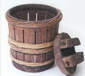
ジンドウ (柿渋しぼり桶) / 京都府立山城郷土資料館