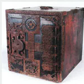
丹後廻船船たんす / 京都府立丹後郷土資料館