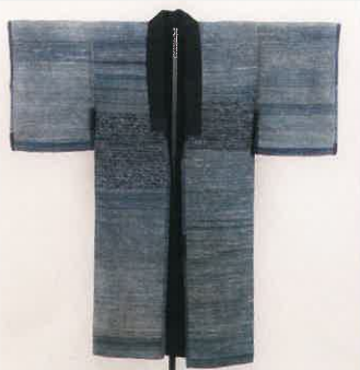
木綿裂き織り着物 / 京都府立丹後郷土資料館