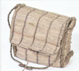
メシガマス (山行き弁当箱入) / 京都府立丹後郷土資料館