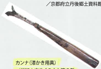
カンナ (漆かき用具) / 福知山市やくの木と漆の館