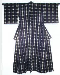
相楽木綿格子縞経緯縞着物 / 京都府立山城郷土資料館