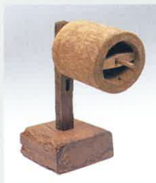
銅繰器 (養蚕製糸用具) / 京都府立丹後郷土資料館