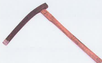
メヨキ (役用具) / 南丹市立日吉町郷土資料館