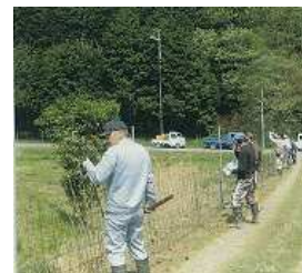
鳥獣防護柵の設置(上豊富)