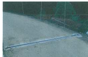
農道排水路の設置(上六人部)