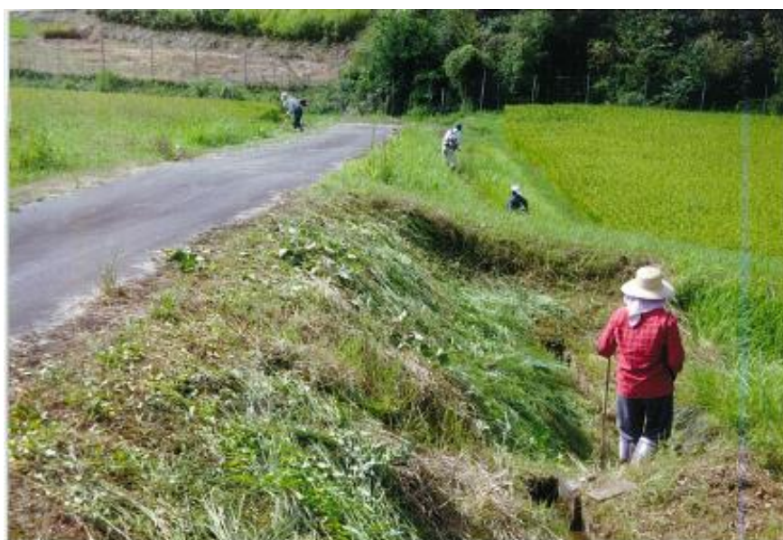
農道法面の草刈り