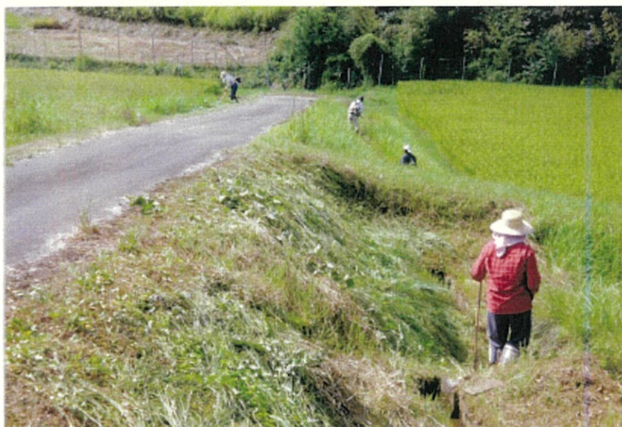
農道法面の草刈り