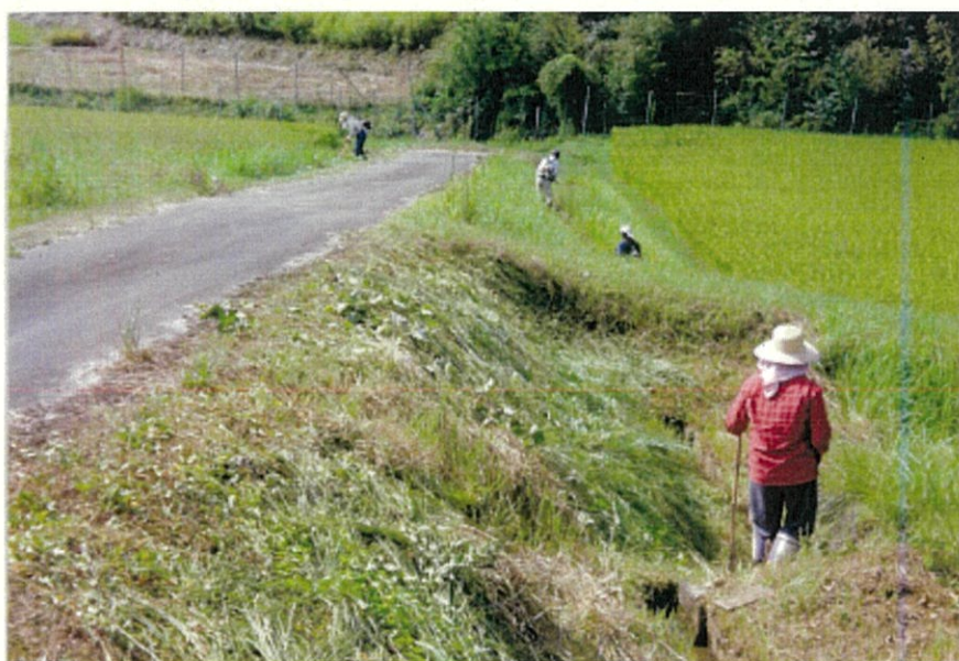
農道法面の草刈り

4. 交付金額 123,967,506 円 (平成28年9月、平成29年2月の2回に分けて交付)