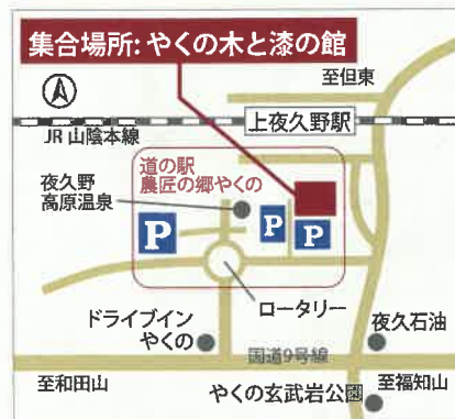
京都府福知山市夜久野町平野2199 JR上夜久野駅から徒歩7分

時間厳守 やくの木と漆の館よりバスにて植栽地へと移動いたします。必ず集合時刻(11:00)を守ってください。 持ち物・服装 軍手・長靴・長袖長ズボン・帽子・タオル 汚れてもよい服装でご参加ください。