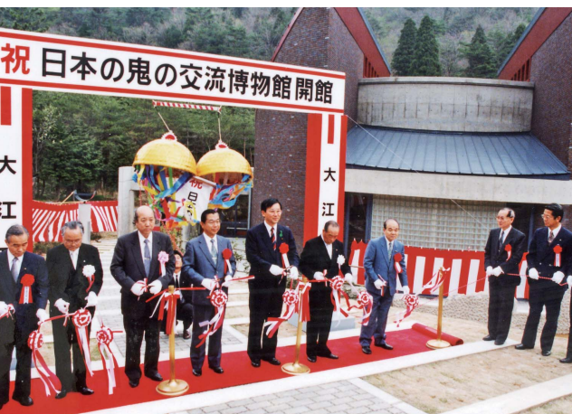
日本の鬼の交流博物館 開館 (平成5年)

平成の30年間はあなたにとってどんな時代でしたか？ 広報ふくちやま2月号で実施した企画「みんなで決める！平成の福知山ビッグニュース」でみなさんからいただいたアンケートと一緒にふりかえってみましょう！