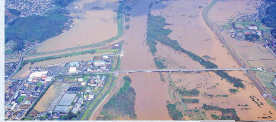
上 平成16年 台風23号時の荒河付近 下 平成25年 台風18号での災害復旧作業