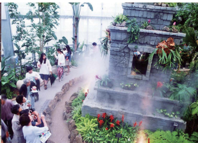
福知山市都市緑化植物園 開館 (平成2年)