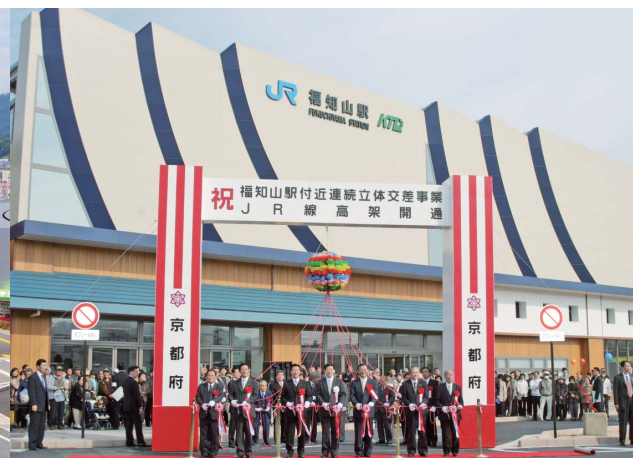
J R福知山駅 高架化し開業 (平成17年)