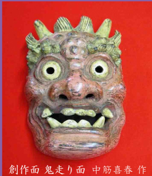
創作面 鬼走り面 中筋喜春作