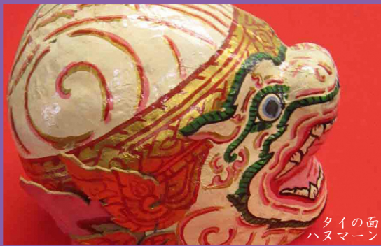
タイの面 ハヌマーン