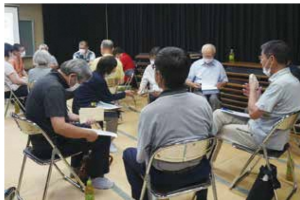
上豊富地区福祉推進協議会「福祉研修」

誰もが住み慣れた地域で暮らし続けることができるよう、各地域の課題などについて、一緒に話し合う場づくりを進め、各地域の福祉活動を支援します。