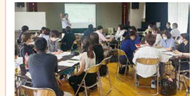
地域づくりを学ぶ研修会