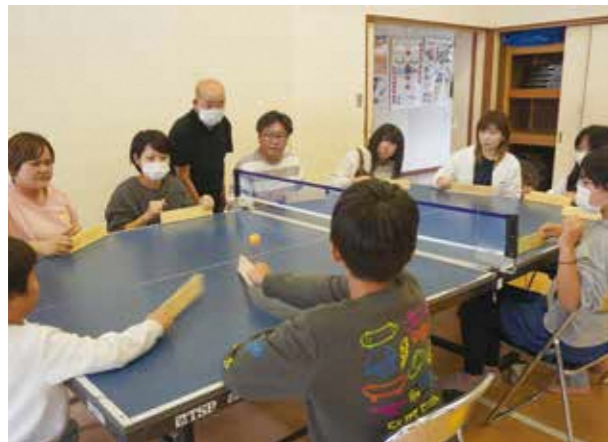
南佳屋野児童館卓球バレー体験

すべての世代や多様な立場の方が、交流や触れ合いを通じて福祉を学べる機会をつくります。