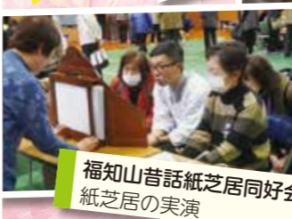
福知山昔話紙芝居同好会 紙芝居の実演