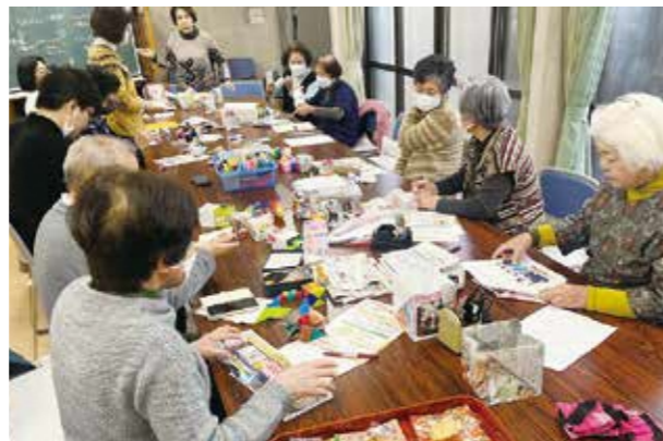
すみれ会（大池坂町）のサロン活動

高齢者や障害のある人、子育て中の親子等が交流し、地域での関係づくりや見守りにつながるサロン活動を支援します。