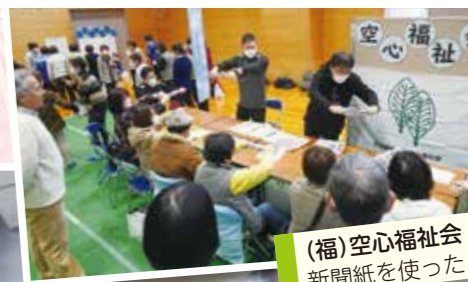
(福) 空心福祉会 新聞紙を使ったレク