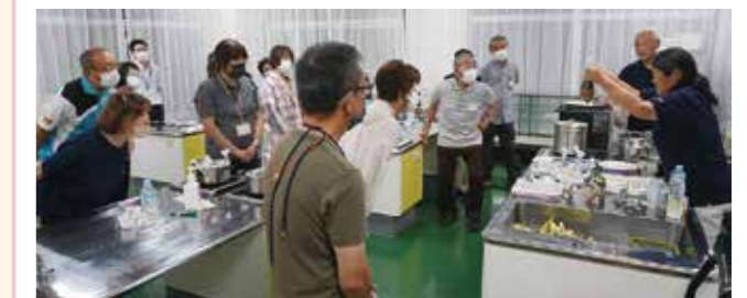
福知山市社協 防災ミニスクール

「防災」について学び合う機会を持ち、地域の防災力を高めるとともに、住民同士の繋がり、出会いのきっかけづくりを支援します。