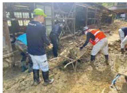
被災された方とボランティアのマッチング

平常時から災害ボランティアの活動を推進し、地域住民を主体とした防災・減災に向けた取組みの促進を図ります。非常時には災害ボランティアセンターを開設し、災害ボランティア活動を支援します。