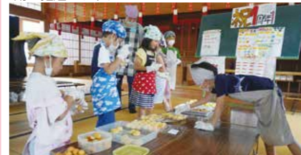
子ども食堂「昭和ぶんぶく食堂」