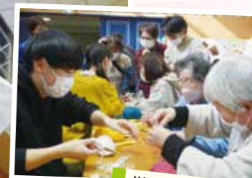
学生団体ちゃったのま 簡単あみもの体験